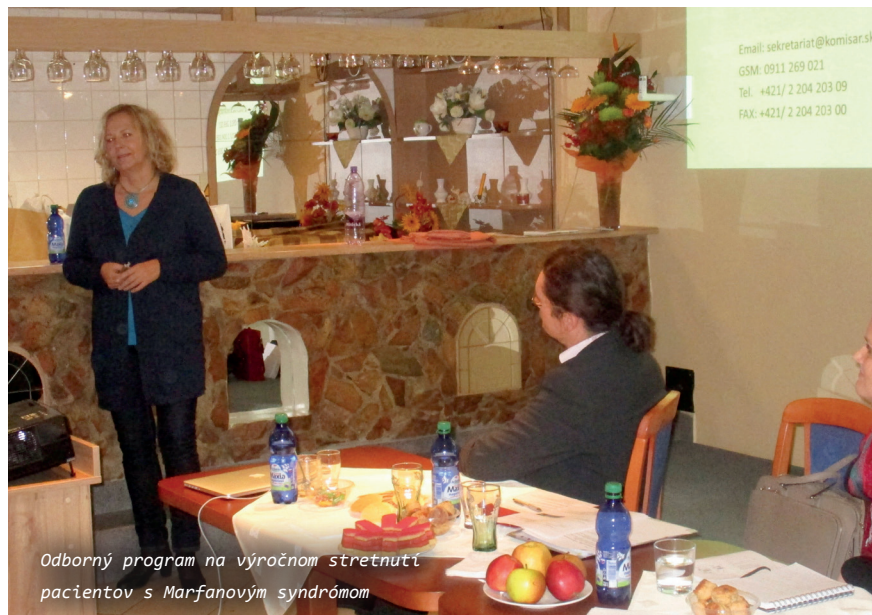
Odborný program na výročnom stretnutí pacientov s Marfanovým syndrómom