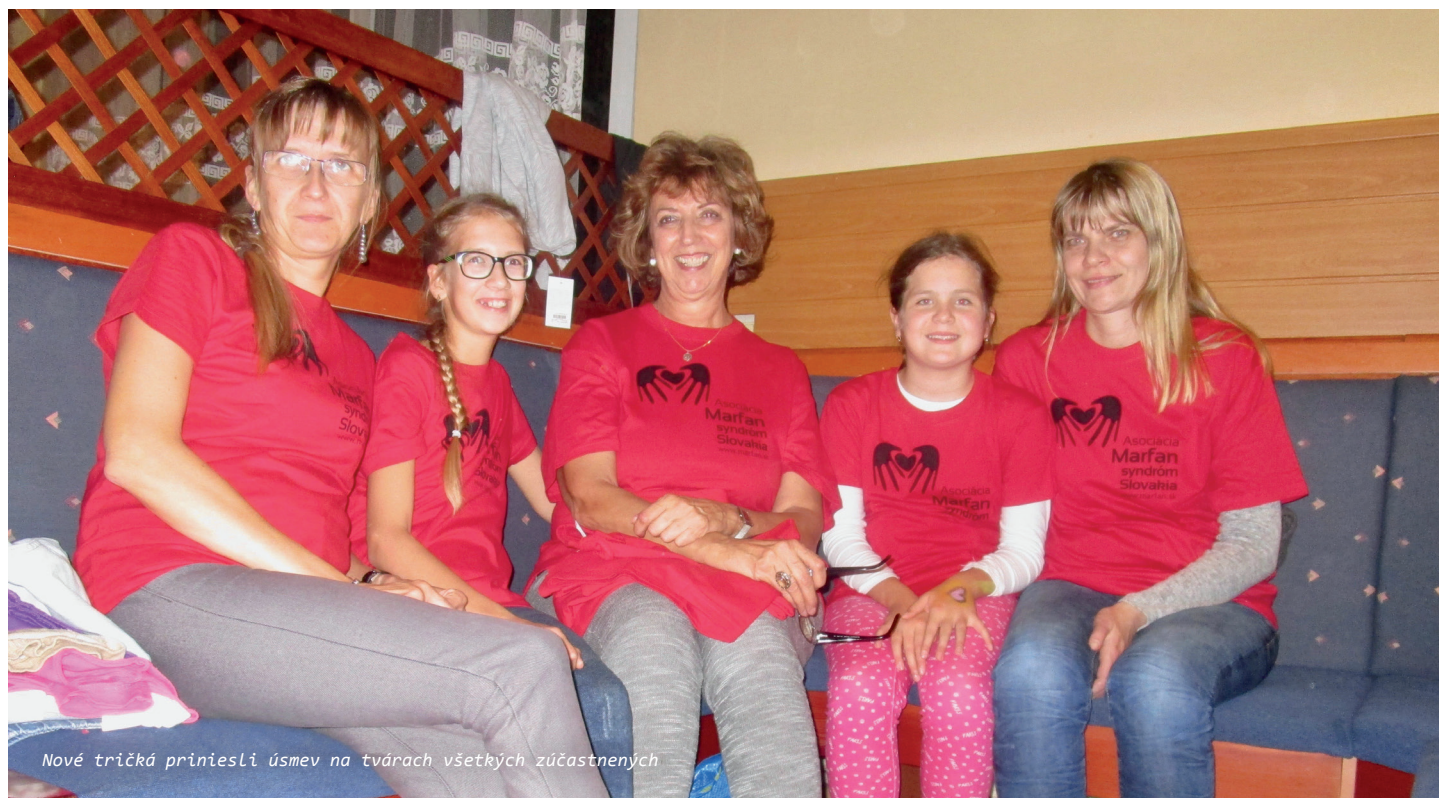
Nové tričká priniesli úsmev na tvárach všetkých zúčastnených